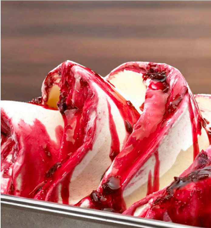
Milcheis Buttermilch mit Marmorias Sauerkirsche