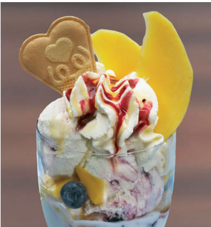
Coppa Fit for Fun